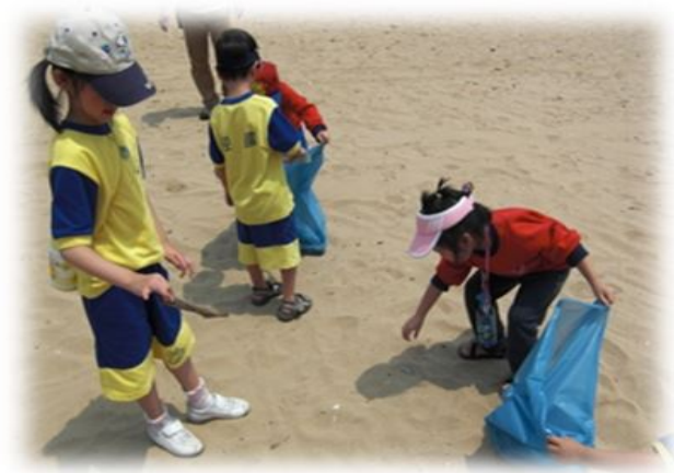
圖6. 守護海洋的天使

再者，老師引導幼兒於小組活動中，2-3人一組，一起合作繪製愛護海洋的宣傳海報（如圖7.所示），配合此次統整活動到外木山淨灘活動，將更是落實愛護海洋方式的一個好機會，當天邀請家長與幼兒一起親子淨灘趣（如圖8.所示）~~在親子合作努力下，當天大家都相當賣力的使用夾子將沙岸上的垃圾找出來，看到幼兒找到或夾起一個垃圾時，臉上就露出滿滿的成就笑臉！大家都動手為大自然盡一份心力，期許這樣良善的種子能在每位幼兒的心中逐漸發芽、生長、茁壯，就從個人做起，相信每個人小小的力量，匯聚起來就能讓浩瀚蔚藍的海洋永久保有、保留美好的一面。