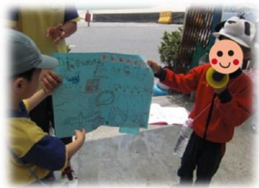
圖7. 繪製愛護海洋的宣傳海報