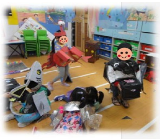
圖2. 孩子穿著海洋生物服裝