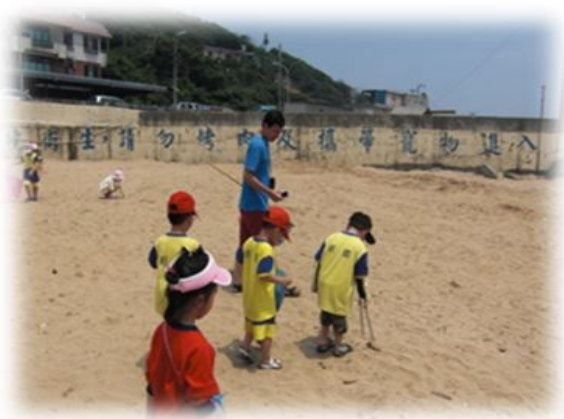
圖8. 家長與幼兒一起親子淨灘