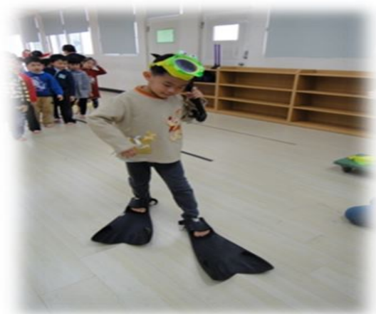
圖5. 幼兒蛙人競走遊戲

接著，透過認識海洋的功能，老師帶領幼兒一起親身體驗在陸地上的蛙人競走遊戲（如圖5.所示），幼兒能雙腳穿著蛙鞋，然而當幼兒嘗試自己實際體驗走一小段路，才了解原來穿蛙鞋走路可不是一件簡單的事喔！在這過程中要使身體在動態行進中保持平衡，幼兒展現不錯的身體平衡感、應變能力，以及能覺察各種用具的安全操作技能。